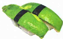
SUSHI AVOCAT 3.50€