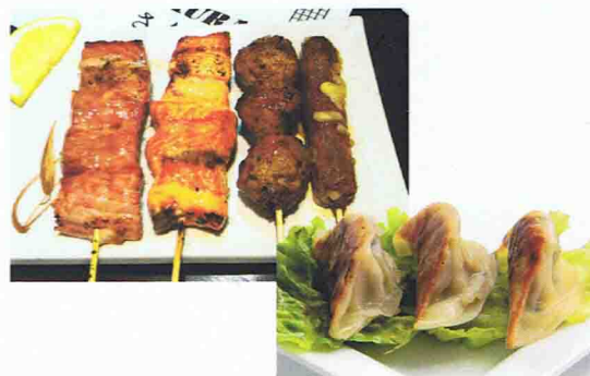
2 MENU YAKI GYOZA 16.50€ Soupe Miso, Salade de choux, Riz 4 Brochettes (1 boulette de poulet, 1 chesses, 1 saumon, 1 thon) 6 Gyoza