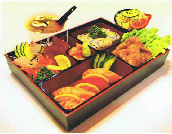
Menu B1 Plateau Bento 17,00 € Salade de chou, Soupe miso, Riz 6 Sashimis, 8 California 4 Nuggets, 3 Sushis,