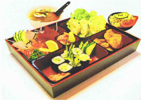
Menu B2 Plateau Bento 17,00 € Salade de chou, Soupe miso, Riz 6 Sashimis, 8 Makis (concombre), 3 Gyosa raviolis, 4 Nuggets