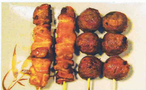
TORIDON 7.50€ Soupe Miso, Salade de chou, Riz 4 brochettes ( 2 boulettes de poulet, 2 poulet )