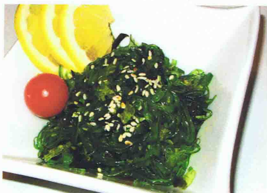
Salade Wakame ( Algues marinés ) 3,00€