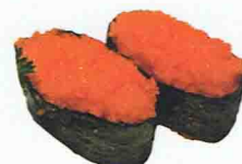
SUSHI OEUF CAPLIN 4.50€