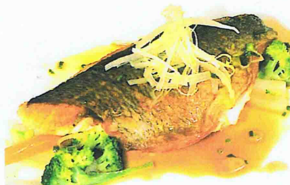
S4 - DAURADE GRILLÉE SAUCE SAKÉ ET SOJA PARFUMÉ