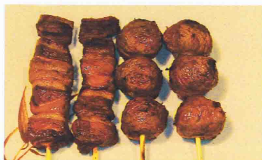
KAMODON 8.50€ Soupe Miso, Salade de chou, Riz 4 brochettes ( 2 boulettes de poulet, 2 canard )