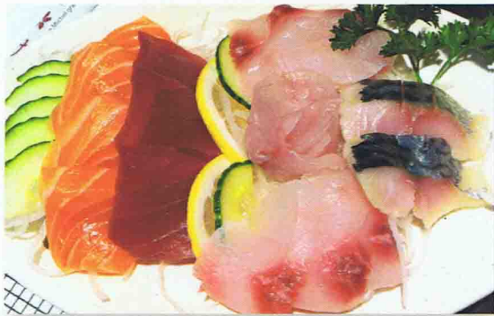
24 SASHIMI MORI 14.50€ Soupe Miso, Salade de chou, Riz 18 Sashimis en assortiment de poissons crus