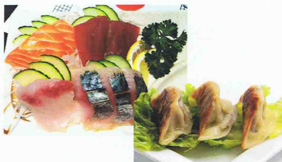
1 MENU SASHIMI GYOZA 16.50€ Soupe Miso, Salade de choux, Riz 12 Sashimis en assortiment 6 Gyoza