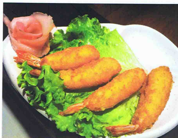
Tampura crevettes cheese 6,00 €