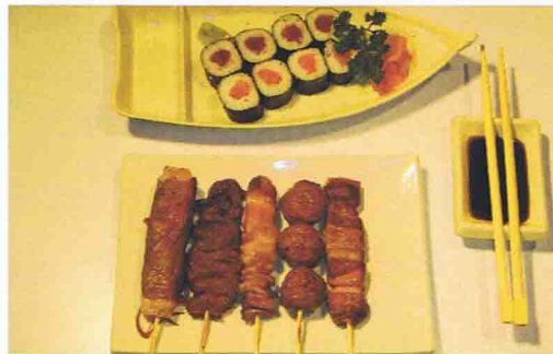
20 YOKOHAMA 15.00€ Soupe Miso, Salade de choux, Riz 8 Maki, 5 brochettes

Soupe Miso, Salade de choux, 8 pièces de California Maki 16 pièces de Maki