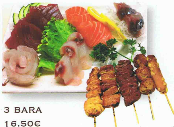
3 BARA 16.50€ Soupe Miso, Salade de choux, Riz 14 Sashimis en assortiment ou tous Saumon et 5 Brochettes