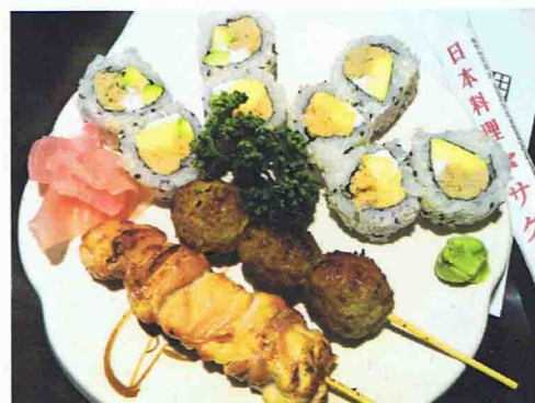
M9 9.50€ Soupe Miso, Salade de choux, Riz 4 California Maki Thon Cuit 4 California Maki Saumon Cuit 2 Brochettes