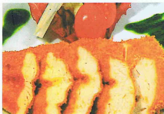
S3 - TORI KASTU (BLANC DE POULET PANÉ FRIT)