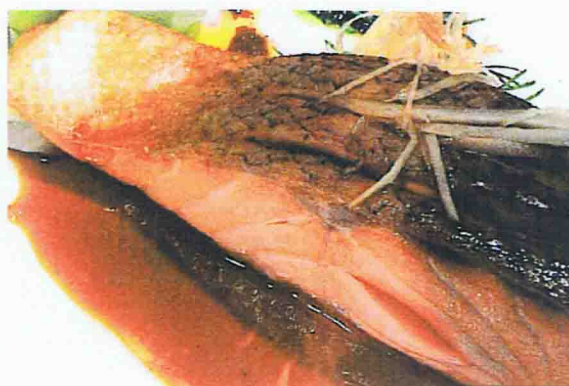
S2 - SUPRÊME DE SAUMON POËLÉ À LA SAUCE TÉRIYAKI