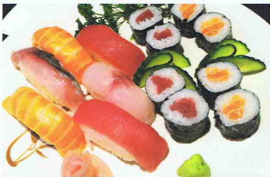
26 SUSHI BENTO 16.50€ Soupe Miso, Salade de chou, 6 pièces Sushi et 8 pièces Makii