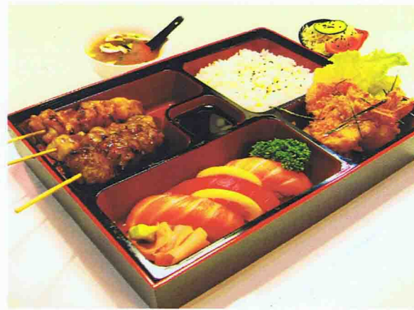
Menu B4 Plateau Bento 17,00 € Salade de chou, Soupe miso 3 Brochettes ( Poulet, Boulette de poulet, chesse), 3 Sushis 3 Beignets crevette, 1 Riz vinaigré