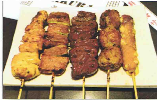
16 HAGI 11.50€ Soupe Miso, Salade de choux, Riz 5 brochettes

Soupe Miso, Salade de choux, Riz 8 brochettes de Yakitori ( 2 saumon, 2 thon, 2 gambas, 2 coquilles St-jacques )