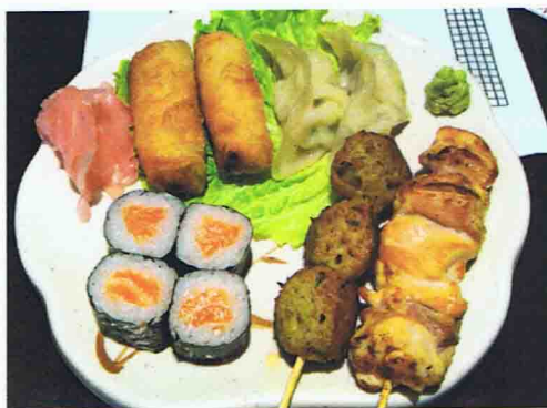
M8 10.00€ Soupe Miso, Salade de choux, Riz 2 pièces Gyoza , 2 Nem 4 Maki saumon, 2 brochettes