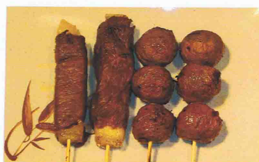
TOKYO 8.50€ Soupe Miso, Salade de chou, Riz 4 brochettes ( 2 boulettes de poulet, 2 chesses )