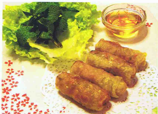
Nems au saumon (5 pièces) 6,00 €