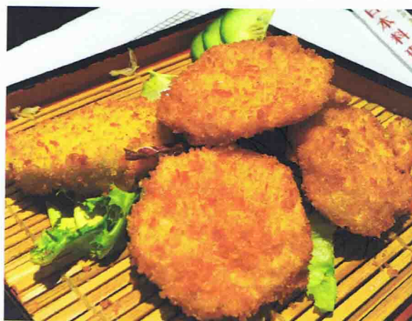
Tempura Légumes (5 pièces) 5,00 € Tempura Poisson (5 pièces) 5,50 €