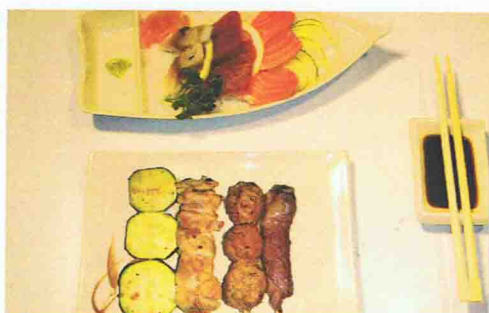
AKASAKA 10.00€ Soupe Miso, Salade de chou, Riz 6 Sashimi ou 2 Sushi 4 brochettes ( boulettes de poulet, poulet, boeuf fromage, courgette )