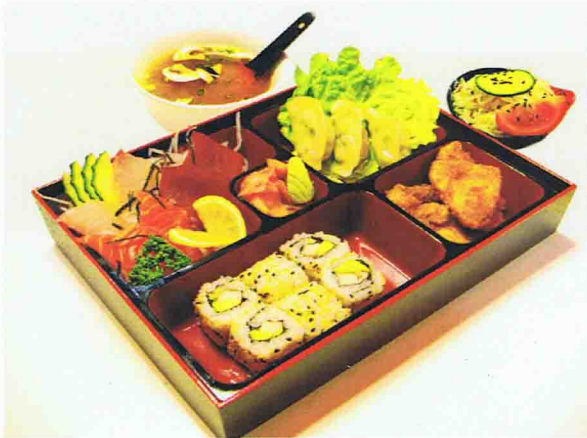
Menu B3 Plateau Bento 17,00 € Salade de chou, Soupe miso, Riz 6 Sashimis, 8 California 3 Gyosa raviolis, 4 Nuggets