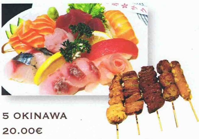
5 OKINAWA 20.00€ Soupe Miso, Salade de choux, Riz 14 Sashimis en assortiment 2 Sushi 5 Brochettes