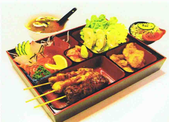
Menu B5 Plateau Bento 17,00 € Salade de chou, Soupe miso 6 Sashimis, 3 Gyosa raviolis 3 Brochettes ( Poulet, Boulette de poulet, chesse), 4 Nuggets, Riz