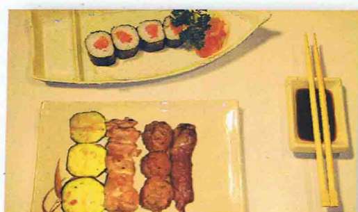
SAMOURAI 9.50€ Soupe Miso, Salade de chou, Riz 4 Maki 4 brochettes ( boulettes de poulet, poulet, boeuf fromage, courgette )