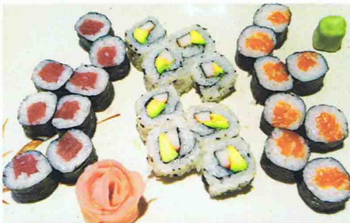
19 TOYAMI 15.50€

Soupe Miso, Salade de choux, 8 pièces de California Maki 16 pièces de Maki