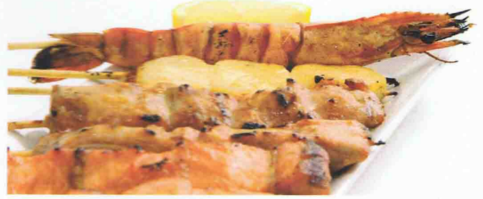
23 OKAYAMA 16.00€ Soupe Miso, Salade de chou , Riz 7 Brochettes ( 1 Gambas, 1 Coquille St - Jaques, 1 Saumon, 1 Thon, 1 Boulette poulet, 1 Chesse, 1Caille)