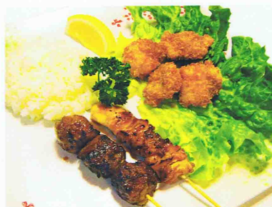
Menu Enfant B 6,50€ 2 Brochettes, 4 nuggets avec du Riz 1 Dessert boule Glace