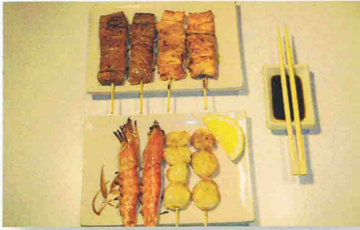
15 NIKO 18.50€

Soupe Miso, Salade de choux, Riz 8 brochettes de Yakitori ( 2 saumon, 2 thon, 2 gambas, 2 coquilles St-jacques )