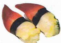
SUSHI HOKKIGAI 5.00€