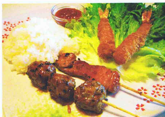
Menu Enfant A 6,50€ 2 Brochettes, 2 Beignets crevettes avec du Riz 1 Dessert boule Glace