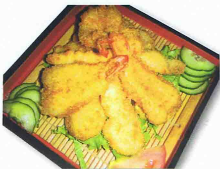
21 TEMPURA 14.00€ Soupe Miso, Salade de choux, Riz Beigne crevettes, poissons, légumes

20 A YOKOHAMA 16.00€ Soupe Miso, Salade de choux, Riz 8 California, 5 brochettes