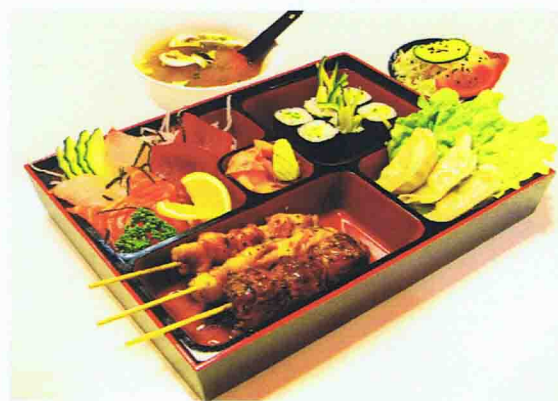
Menu B6 Plateau Bento 17,00 € Salade de chou, Soupe miso 6 Sashimis, 8 Makis (concombre), 3 Brochettes( Poulet, Boulette de poulet, chesse), 3 Gyosa raviolis, Riz