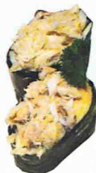
SUSHI CRABE 5.00€