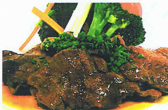
S1 - TRANCH DE BOEUF SAUCE CARAMÉLISÉE

TOUS NOS PLATS SONT ACCOMPAGNÉ : 1 SOUPE, 1 SALADE, 1 RIZ NATURE