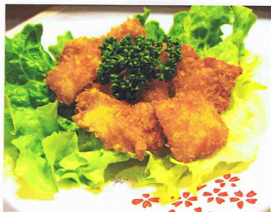
Nuggets Maison (6 pièces) 5,50 €