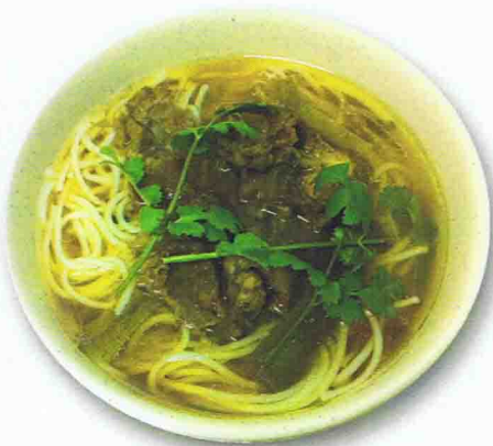
Soupe Udon au boeuf et légumes 8.90 €