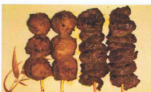
IKUDON 7.50€ Soupe Miso, Salade de chou, Riz 4 brochettes ( 2 boulettes de poulet, 2 boeuf )