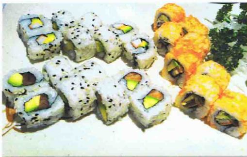
17 OSAKA 16.50€

16 HAGI A 13.00€ Soupe Miso, Salade de choux, Riz 5 brochettes de boeuf du fromage