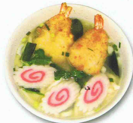
Soupe Udon au tempura crevettes et pâte du poisson 9.80 €