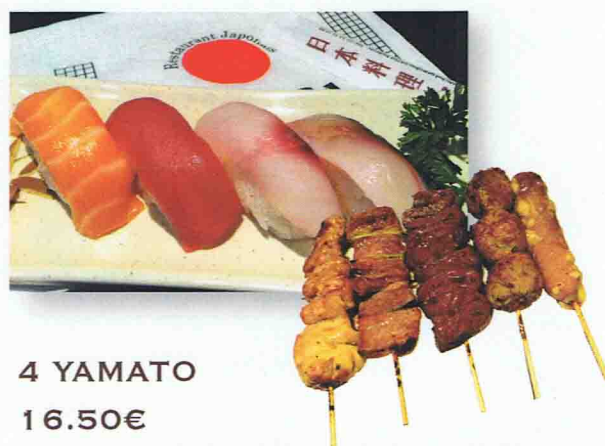
4 YAMATO 16.50€ Soupe Miso, Salade de choux, Riz 4 Sushi 5 Brochettes