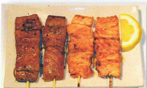
MAGUROYAKI 9.00€ Soupe Miso, Salade de chou, Riz 4 brochettes ( 2 saumon, 2 thon )