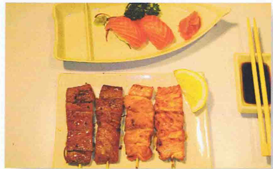
25 SHAKE-DON 12.50€ Soupe Miso, Salade de chou, Riz 2 Pièce de sushi saumon, 4 brochettes de poissons