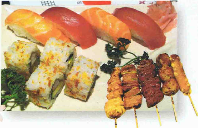
22 MENU MIXTE 20.50€ Soupe Miso, Salade de chou, Riz 4 Sushi, 4 California Maki 5 Brochettes