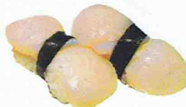
SUSHI ST-JACQUE 5.00€