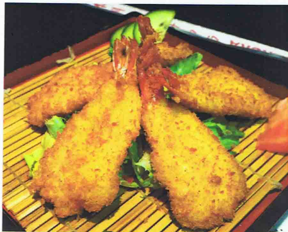
Tempura Crevette (5 pièces) 6,00€ Tempura Noix de St Jacques (5 pièces) 6,00€