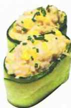
SUSHI CRABE ÉPICÉ 5.00€