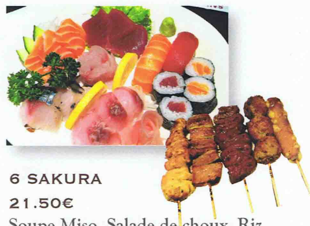
6 SAKURA 21.50€ Soupe Miso, Salade de choux, Riz 14 Sashimis en assortiment 2 Sushi, 4 Maki 5 Brochettes